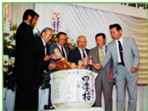
6組合長による鏡開き