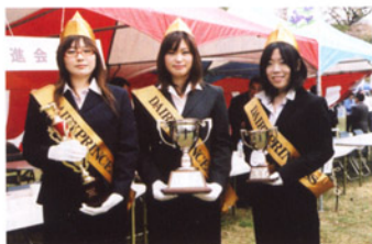
デイレープリンセス