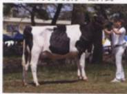
4部 宇都宮市 363ランド ファーム