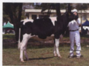
1部 真岡市 真岡北陸高校