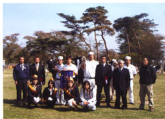
名誉賞を受賞した皆さんとともに