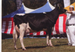
グリーンハイツ ゴールデン マウイ ET