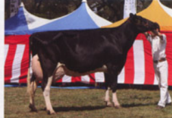
MM ブラック ルドルフ