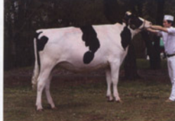
バインツリー グラチヤン ヒーローズ